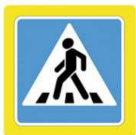
Наземный пешеходный переход