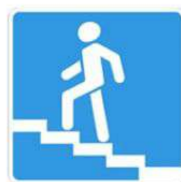
Надземный пешеходный переход